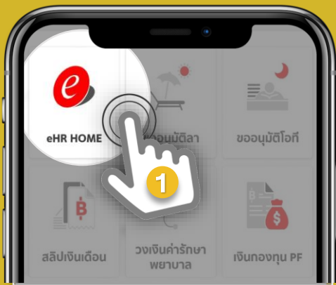
1. เลือก “eHR”