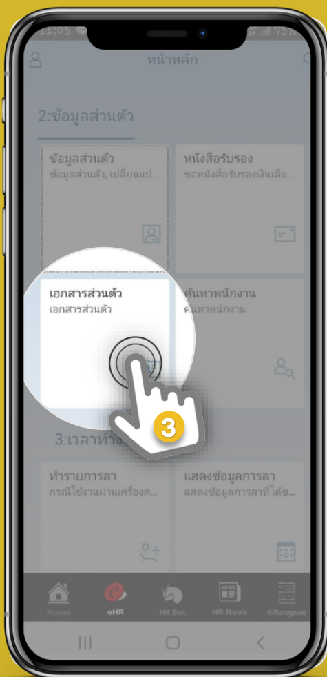
3. เลือก “เอกสารส่วนตัว”