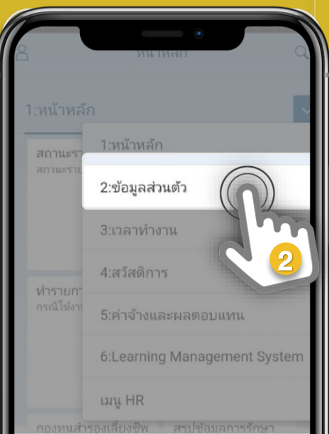
2. เลือก “ข้อมูลส่วนตัว” (หรือ Org. & Personal Info.)

โปรดทราบ พนักงานที่ไม่เป็นสมาชิกกองทุน PF ของ SCG ไม่ สามารถดู “ใบรับรองและแจ้งยอดเงิน PF” ตามวิธีการนี้ได้ โดยจะได้รับเอกสารจากนายทะเบียนส่งให้ตามปกติ